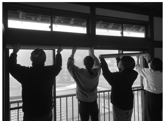
写真3 DIY作業(カーテンレール修繕)の様子