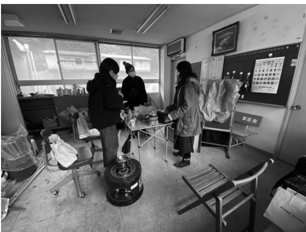
写真2 家島でのヒアリングの様子